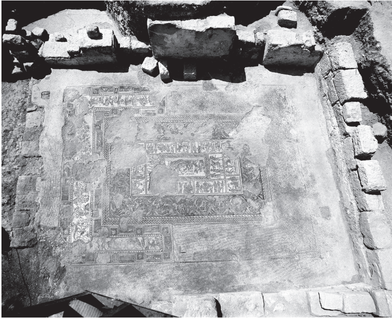
איור 6: הטרקלין בבית דיוניסוס בציפורי.

חדרי הטרקלין הקדומים ביותר העשויים במתכונת הרומית מתוארכים לסוף המאה השנייה או לראשית המאה השלישית לסה"נ. בעין יעל נחשפה וילה רומית שלדעת חופר האתר גרשון אדלשטיין שימשה נטרן רומי מהלגיון העשירי, ובה נמצא טרקליניום (אדלשטיין 1990; אדלשטיין תשנ"ד; רוזין 1995, 31). טרקליניום נוסף נמצא בנאפוליס, והוא ככל הנראה מן המאה השלישית (רופין 1979, 22–30; מגן תשס"ה, 74). 18 אולם גם כאן מדובר באוכלוסייה נוכרית או שומרנית ולא באוכלוסייה יהודית. הדוגמאות היחידות לקיומו של בית רומי הכולל טרקליניום באזור שבו התגוררה אוכלוסייה יהודית נמצאות בציפורי: בבית דיוניסוס, המתוארך לסוף המאה השנייה או לראשית המאה השלישית לסה"נ (וייס תשס"א, 9; טלגם ווייס 2004, 17) ובבית אורפאוס, המתוארך לאמצע המאה השלישית לסה"נ (וייס תשס"ד, 98; טלגם ווייס 2004, 9) (איוורים: 6–7). בתים אלו בנויים במתכונת בית פריסטיל, והטרקליניום נמצא בחלק האחורי של המבנה ופונה אל החצר הפריסטילית.