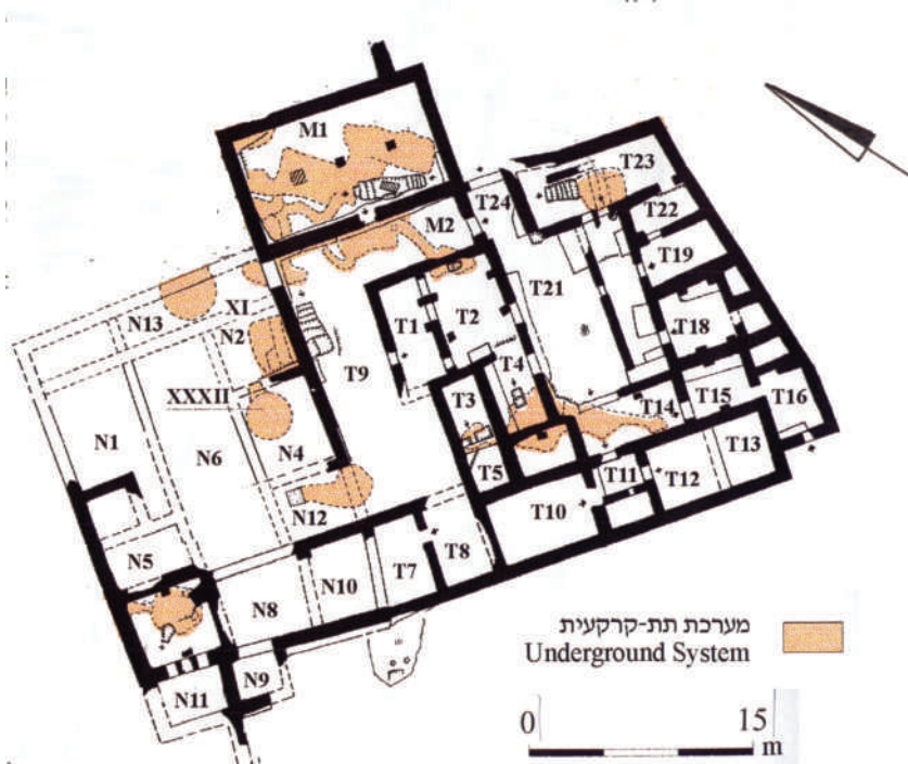
איור 5: חורבת עתרי (מתוך: זיסו וגנור תשס"ב, 22).