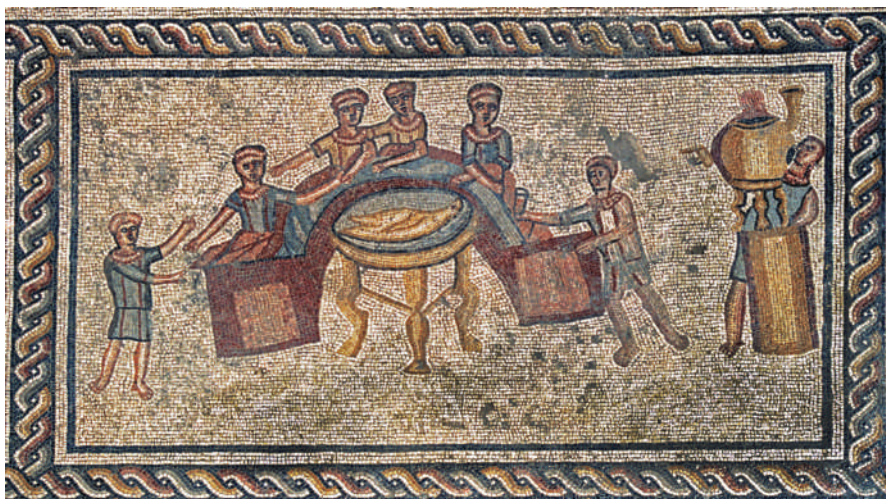
איור 3: סצנה של משתה בפסיפס בית אורפאוס בציפורי בטרקלין בדגם סטיבדיום (stibadium).

זנב לאריות ולא ראש לשועלים" (משנה, אבות ד, טו, כ"י קאופמן). שמואל ספראי וזאב ספראי מעלים את האפשרות שאמירת השלום הנזכרת במשנה היא למעשה שאילת הקליינט לשלום הפטרון, והסיפה של המשנה יכולה להתפרש כהמלצה של החכם: היה קליינט של פטרון חשוב, "זנב לאריות", ולא פטרון זוטר, "ראש לשועלים" (ספראי וספראי תשע"ג, 286–283). יוצא אפוא ששתי הדרשות ממסכת אבות מתבססות על הכרת בית המגורים הרומי ואופי הטקסים המתבצעים בו. ממקורות חז"ל של סוף התקופה הרומית, המאות השלישית והרביעית לסה"נ, עולה שתופעת הפטרונוז' מוכרת, וחז"ל משלבים בדרשותיהם סיפורים הקשורים ליחסי פטרון–קליינט (ליברמן תשכ"ג, 49–50; שפרבר 1978, 119–135).